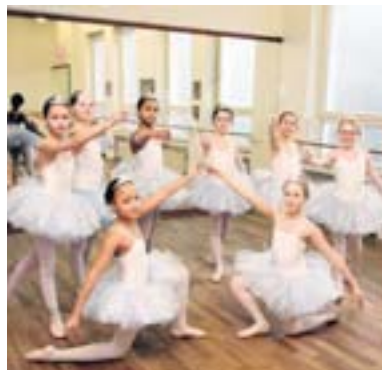
Ballettkinder der Tanzschule Houben bei den Proben für den Traumzauberwald.

Im nächsten Jahr kommt Reinhard Lakomy wieder nach Krefeld. Mit einem Weihnachtsprogramm und der „Zauberfee“, das wollen wir uns doch wünschen.