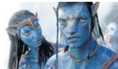
Eine Szene aus „Avatar“ mit Neytiri und Jake.

FT Casablanca/Cinema, Lewerenzstr. 40, Telefon: 02151 314180.